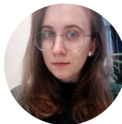
Kordynatorka ds. komunikacji i klimatu