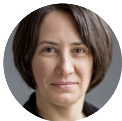
Koordynatorka projektu "Silniejszy głos organizacji społecznych w działaniach rzeczniczych". Do 30.11.2023 r.