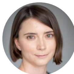
Ekspertka ds. rzecznictwa i działalności edukacyjnej